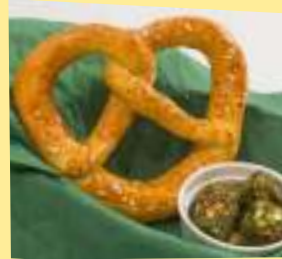
Брецель с маслом Pretzel, butter on the side 120 rub