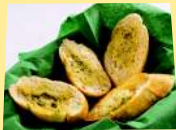
Булочки с маслом Plain buns, butter on the side 80 rub